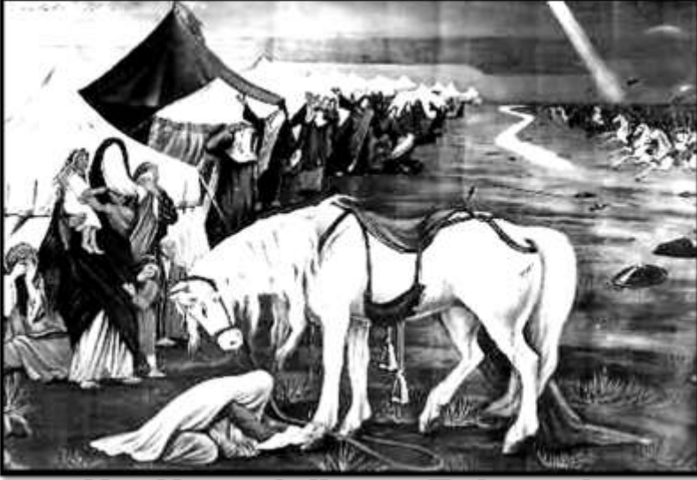
Hz. Hüseyin'in atı Zülcenah